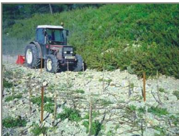
Reconditionarea unei culturi de vita de vie