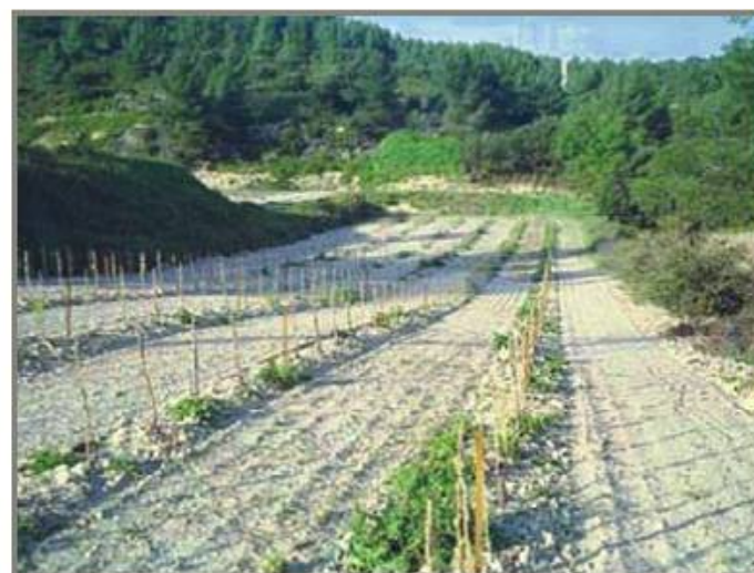
Rezultatul: conditii mai bune pentru culturile agricole

SPARGATOR DE PIATRA PENTRU AMELIORAREA TERENURILOR IN VEDEREA CULTIVARII SAU PENTRU PREGATIREA TERENULUI IN CONSTRUCTII.