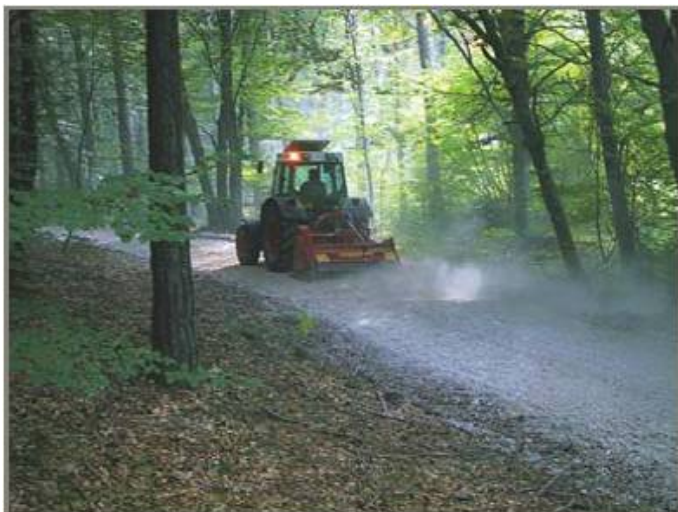
Zdrobirea si maruntirea pietrelor mari de pe un drum forestier