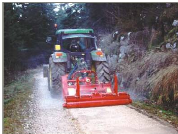
Role pentru compactarea partiala a terenului

MASINA IDEALA PENTRU INTRETINEREA SI REFACEREA DRUMURILOR DE PIATRA, PARCARILOR. RECOMANDAT SI PENTRU REALIZAREA CANALELOR DE SCURGERE A APELOR.