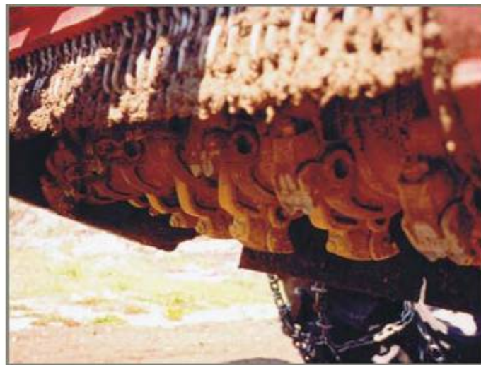
Rotor cu ciocane fixe ce permit eliminarea gro-pilor si a hopurilor din drum.