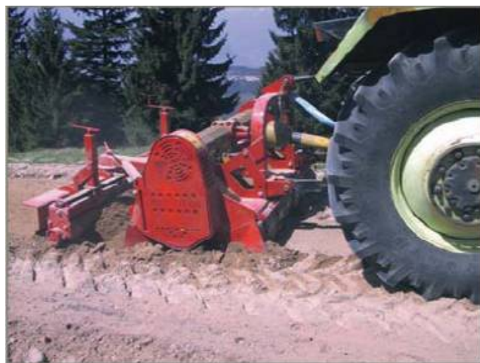
Potrivit si pentru lucrari urbane / comunale