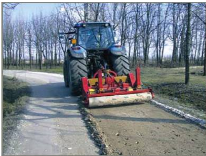
Renovarea unui drum de piatra